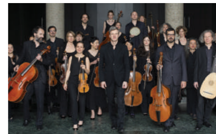
Le Poème Harmonique